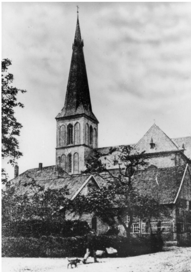
Kirche vor dem Bombenangriff