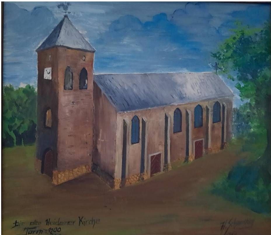
Erste Heidener Kirche 1200 – 1880 - Heimatverein