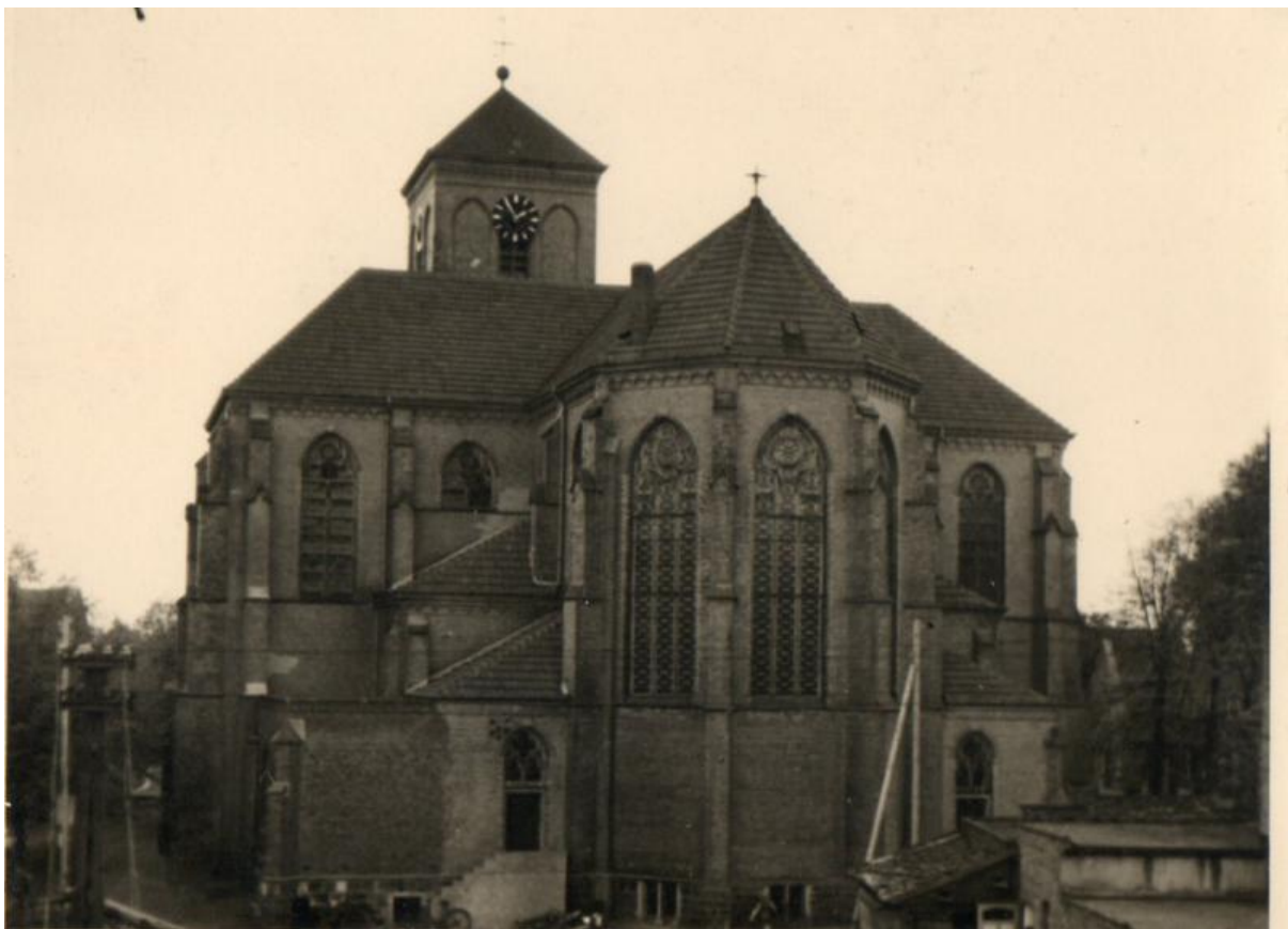
Neu aufgebaute Kirche nach dem Bombenangriff - https://www.sankt-georg-heiden.de/orte/unsere-chronik